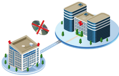
Kein Austausch von CDs mehr nötig