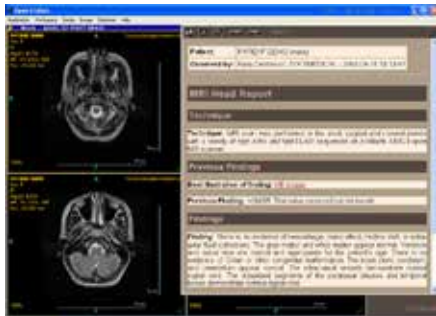
Darstellung eines detaillierten Befundes

Betriebssystem: Microsoft Windows® XP, Vista, 7, 8 Prozessor: Intel Core i5, 2,5GHz (oder höher) RAM: 2 GB Videokarte: 24/32 BIT(höhere)