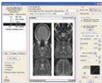
Fenêtre de configuration (Advanced).