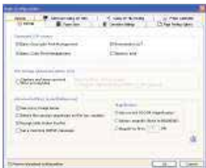
Fenêtre de configuration (Basic).